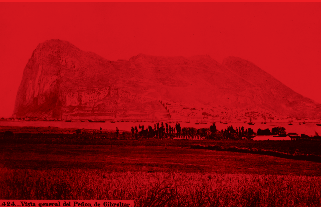
424._Vista general del Peñon de Gibraltar .

Revista Académica sobre la Controversia de Gibraltar Academic Journal about the Gibraltar Dispute